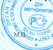
Схема сертификации 1с

Руководитель органа (Зам. Руководителя органа)